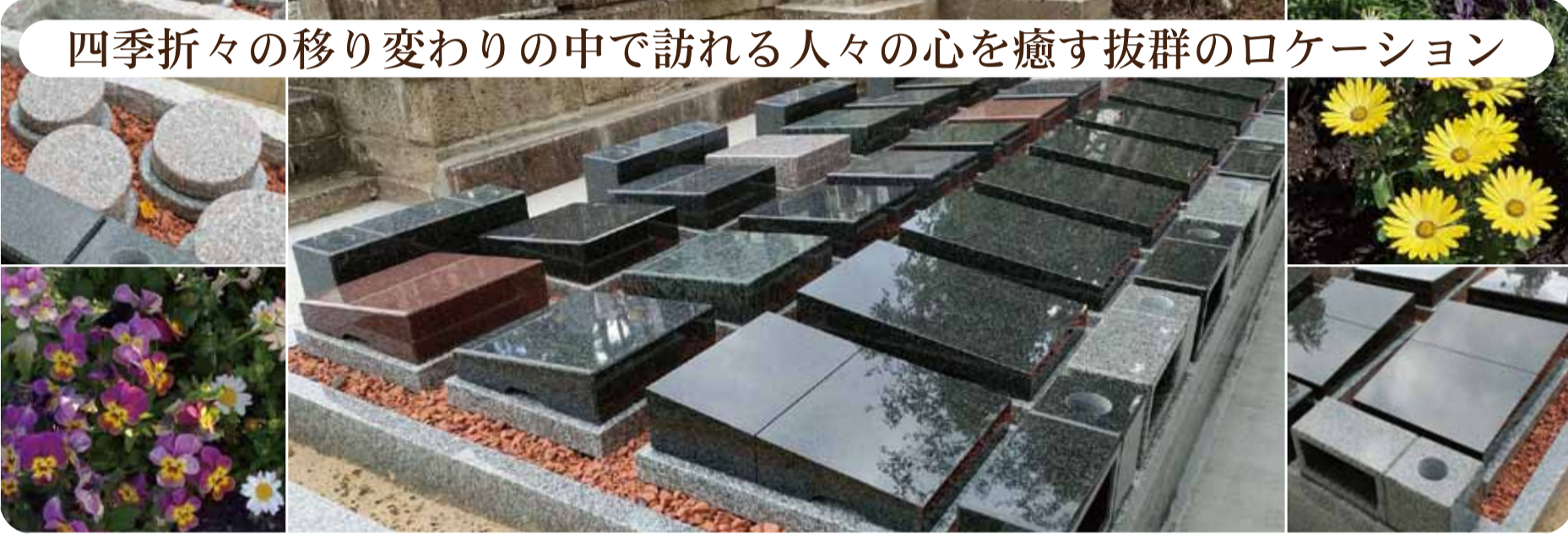
四季折々の移り変わりの中で訪れる人々の心を癒す抜群のロケーション

■交通アクセス・広々駐車場完備! ・『ザ・モール長町』より ・地下鉄南北線『愛宕橋駅』より お車で8分