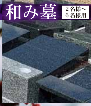
和み墓 2名様~6名様用

お2人様に相応しいお墓 絆墓タイプです 最大3名様迄眠れます。(1名分別途料金) ご夫婦の他にも、親子・友人・知人 同士でもご利用いただけます。 ※別途年間管理費 6,000円 25年分にて全納。 2名様迄 55万円(税込)