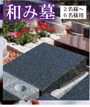
和み墓 2名様~ 6名様用

※別途年間管理費 5,000円 25年分にて全納。 2名様迄 49.5 (税込)万円