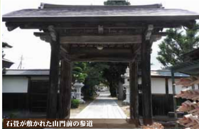
石畳が敷かれた山門前の参道