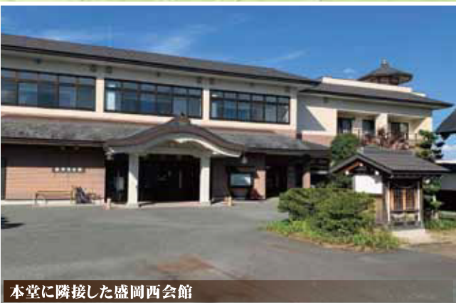
本堂に隣接した盛岡西会館