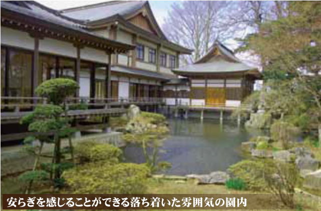
安らぎを感じることができる落ち着いた雰囲気の内園