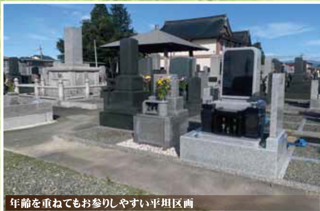
年齢を重ねてもお参りしやすい平坦区画

故郷のお墓の引っ越し(改葬)をお考えの方も、この機会にご相談ください。永代供養墓等お考えの方からのご相談も承ります。