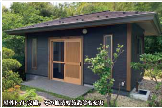
屋外トイレ完備。その他法要施設等も充実