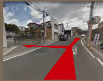
法性院入口の看板が目印です!