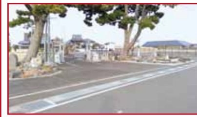
■広々とした駐車場完備の高林寺入口。