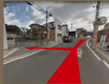
法性院入口の看板が目印です!