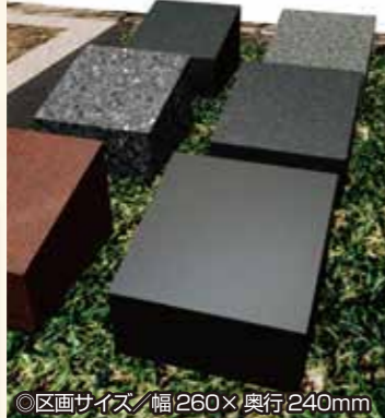
◎区画サイズ/幅260×奥行240mm

個人墓は、おひとり様専用のお墓です。様々な方と一緒に眠る合祀墓とは違い個別で眠れる専用の納骨堂を備えております。